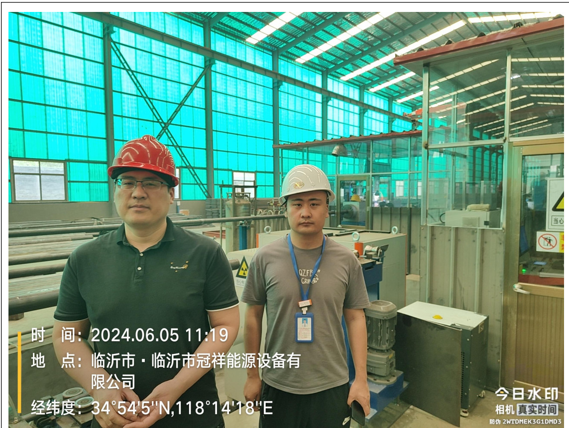
现场采样、检测图像影像